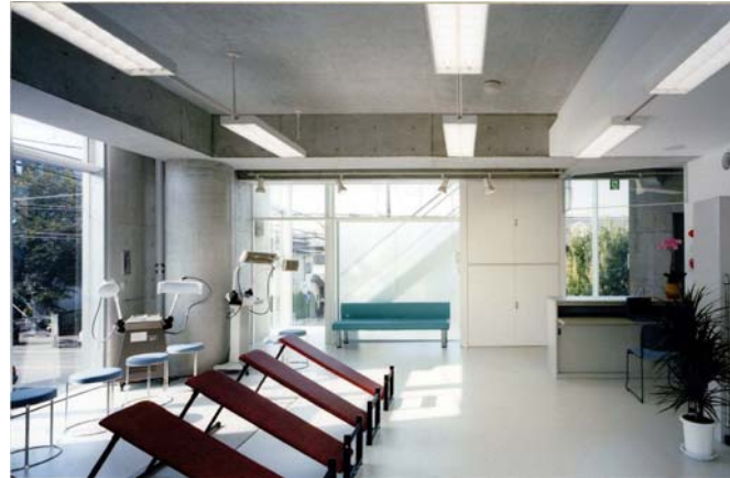
2F Rehabilitation room

理学療法士が軸となり、個々の病状に合わせたリハビリメニューを作成し、メディカルトレーナー他スタッフが治療をお手伝いいたします。